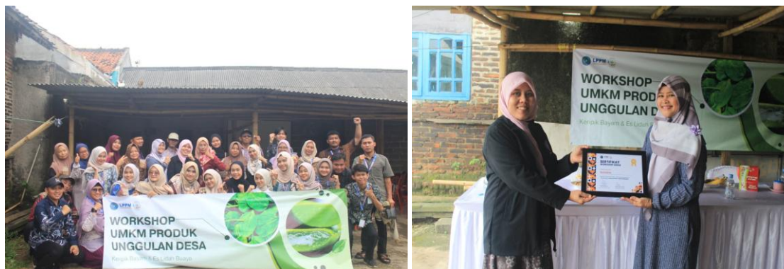
Gambar 6. Dokumentasi Workshop Produk Unggulan Desa (Minuman dari Lidah buaya) dan Penyerahan Sertifikat Peserta Workshop

terlebih dahulu, terutama bagi individu dengan kondisi medis tertentu atau yang sedang mengonsumsi obat-obatan, untuk menghindari efek samping yang tidak diinginkan.