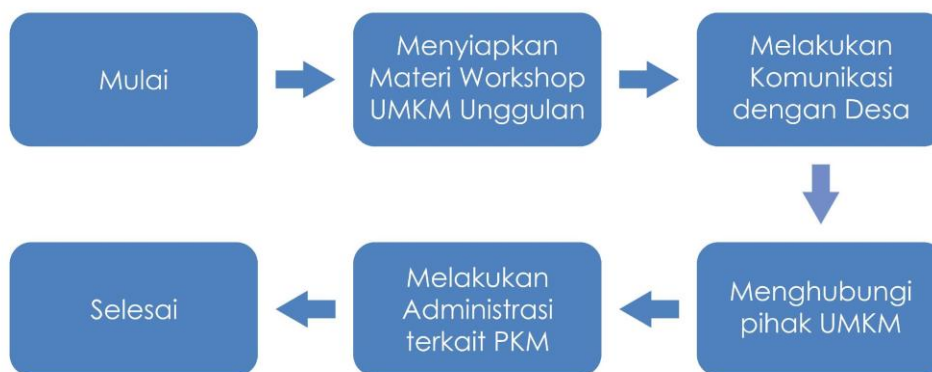
Gambar 3. Langkah-langkah pada tahap perencanaan

Tahap perencanaan merupakan tahapan awal untuk mempersiapkan kegiatan pengabdian masyarakat dimulai dengan pembentukan tim dan pembagian tugasnya masing-masing, survei lokasi, identifikasi masalah, dan usulan program kerja. Selain itu kami menyiapkan peralatan dan perlengkapan untuk pengabdian kepada masyarakat. Pertama, menyiapkan materi workshop UMKM unggulan desa. Kedua, melakukan komunikasi dengan pihak desa mengenai pelaksanaan workshop UMKM. Ketiga, menghubungi pihak UMKM desa Pasar Kemis sebagai pengisi workshop UMKM. Keempat, melakukan survey tempat pelaksanaan workshop UMKM. Persiapan terakhir yakni melengkapi persyaratan administrasi yang berhubungan dengan pengabdian masyarakat. Diagram alir dibawah ini menunjukkan langkah-langkah yang dilakukan pada tahap perencanaan yaitu: