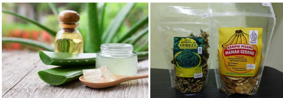
Gambar 5. Bahan Dasar Minuman dari Lidah Buaya dan Produk Unggulan UMKM Desa Pasar Kemis

Kegiatan Workshop Produk Unggulan Desa (Minuman dari lidah buaya) dilaksanakan pada tanggal 14 Agustus 2025 di Balai Warga kampung Picung desa Pasar Kemis pada pukul 14.00-15.00 WIB. Kegiatan ini dilakukan untuk menggunakan metode diskusi interaktif antara narasumber dengan peserta kegiatan dan praktek secara langsung bagaimana membuat minuman dari tanaman lidah buaya oleh ibu Siti Nurlaelly. Harapannya, melalui berbagai inovasi produk dari tanaman di lingkungan sekitar tersebut dapat semakin meningkatkan pengetahuan ibu-ibu dan pelaku UMKM untuk lebih kreatif dalam melakukan inovasi produk UMKM. Tanaman lidah buaya atau Aloe vera adalah tanaman sukulen yang dikenal karena manfaatnya yang luas di berbagai bidang, termasuk perawatan kulit, kesehatan, dan bahkan makanan serta minuman. Tanaman ini mengandung gel bening yang kaya akan senyawa bioaktif seperti polisakarida, vitamin, mineral, dan enzim yang memiliki sifat penyembuhan, antiinflamasi, dan pelembab.