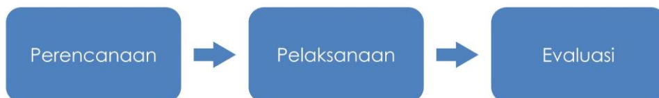
Gambar 2. Alur Pelaksanaan Kegiatan Pengabdian Masyarakat

Kemis, dan perangkat desa di kampung Picung. Pengabdian ini dilaksanakan di wilayah kampung Picung desa Pasar Kemis, kabupaten Tangerang, provinsi Banten, pada hari Kamis 14 Agustus 2025 dengan durasi selama tiga jam. Dalam pelaksanaannya, tim pengabdian masyarakat dibantu oleh tim KKN desa Pasar Kemis Universitas Muhammadiyah Tangerang. Metode pengabdian dilakukan melalui workshop oleh pelaku Usaha Mikro, Kecil, dan Menengah (UMKM), khususnya pemilik usaha di desa Pasar Kemis. Workshop dilakukan melalui serangkaian kegiatan, praktek langsung dan tips dalam pengelolaan UMKM tersebut. Harapannya, melalui kolaborasi yang erat dengan warga kampung dan pemerintah desa setempat, dapat diidentifikasi potensi-potensi yang dapat dioptimalkan untuk mendukung peningkatan kesejahteraan masyarakat, terutama UMKM desa. Metode yang digunakan dalam pengabdian masyarakat ini secara berurutan meliputi perencanaan, pelaksanaan, dan evaluasi.